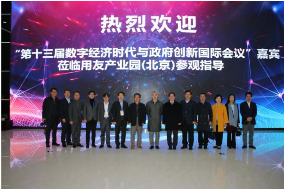
考察用友数字企业体验馆

中韩国际会议于 2007 年首次举办之时就已明确活动宗旨为：聚焦东北亚地区经济与社会发展中出现的重大问题，汇集中韩两国政策制定者与智囊团，为推动东北亚经济的繁荣稳定与协调发展积极探索解决方案。十三年来，中韩国际会议坚持与时俱进，酌定历届主题，力邀著名专家，为促进中韩关系发展、维护东北亚地区的和平与稳定，以及探索解决全球性的问题作出了贡献。